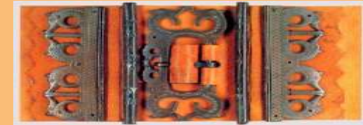
Spätromische Gürtelschnalle 4. Jh. n. Chr.; Fundort: Ehrenbürg. Ausgestellt im Pfalzmuseum Forchheim

UNIVERSALEN WEG ZU SPRACHE UND KULTUR: „BILDUNG OHNE VERFALLSDATUM“